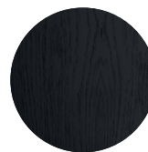
VULCANIC NCS S 8500-N