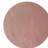
PETRA NCS S 2020 -Y80R