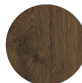
ORZECH NA DĘBIE