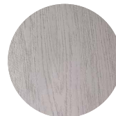
OFF WHITE NCS S 1002 Y50R